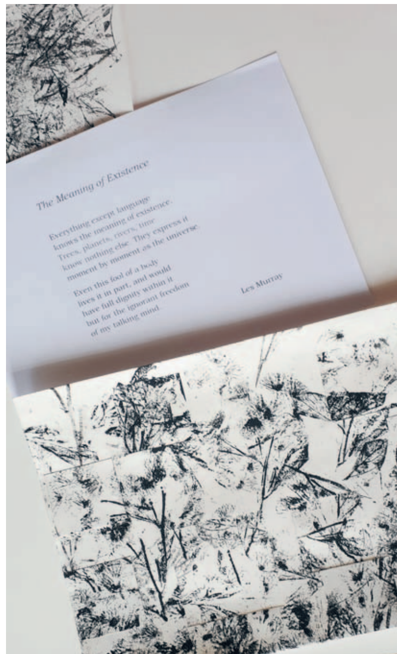
Collage van abstracte natuurbelden van Josefien Alkema, met een gedicht van de op 29 april dit jaar overleden dichter Les Murray.