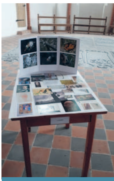
Somers collage over het thema lijden.

goudgele kardoenzaden Kilometers verderop ligt Leermens. In de 11e-eeuwse Donatuskerk houdt Marc de Groot (55) atelier. In het koor scheidt hij een monnikenwerk. 'Sinds jaren werk ik niet meer met